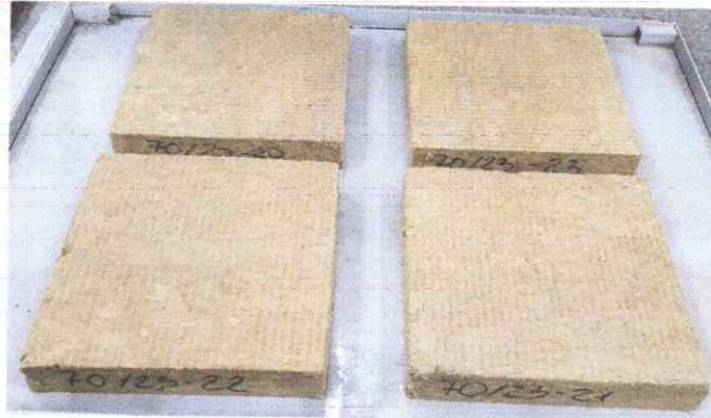
Рисунок 9 – Зволоження дослідних зразків № 70/23 теплоізоляційного матеріалу марки «ТЕХНОРУФ ПРОФ»