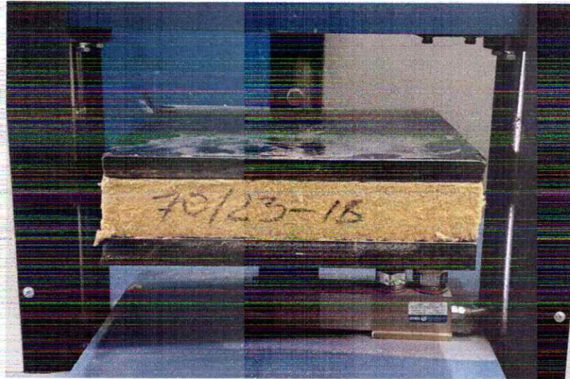
Рисунок 6 – Проведення випробування міцності на стиск при 10% деформації зразків № 70/23 теплоізоляційного матеріалу марки «ТЕХНОРУФ ПРОФ»

Міцність на стиск при 10% деформації \sigma_{10} , кПа, обчислюють за формулою: