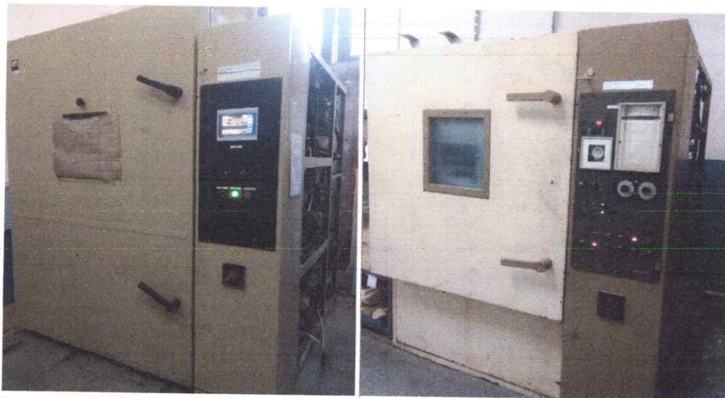
Рисунок 3 – Кліматичні камери для проведення циклічних кліматичних впливів

Кліматична камера для проведення циклічних кліматичних впливів наведена на рис. 3.