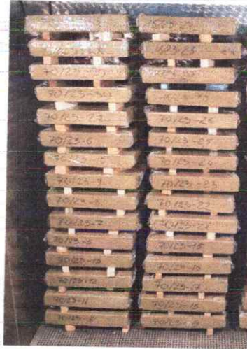
Рисунок 4 – Дослідні зразки №70/23, які піддають циклічному температурному впливу Виконується перевірка виконання умови за формулою (2):