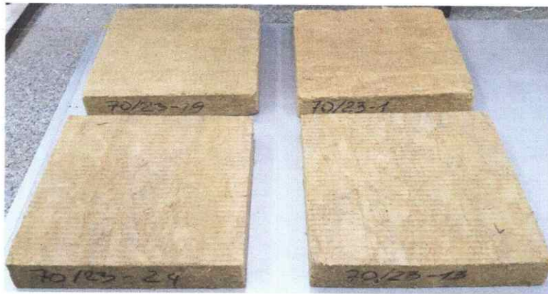
Рисунок 1 – Зразки № 70/23 теплоізоляційного матеріалу марки «ТЕХНОРУФ ПРОФ»

Загальний вигляд зразків № 70/23 показано на рис. 1.