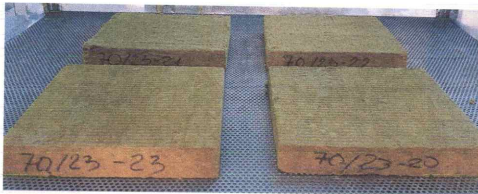
Рисунок 8 – Загальний вигляд дослідних зразків № 70/23 теплоізоляційного матеріалу марки «ТЕХНОРУФ ПРОФ» під час опромінення

11.4 Стійкість експлуатаційних показників теплоізоляційного матеріалу марки «ТЕХНОРУФ ПРОФ» до впливу кліматичної вологи та впливу сонячного опромінення. На рис. 8 зображено дослідні зразки № 70/23 під час опромінення.