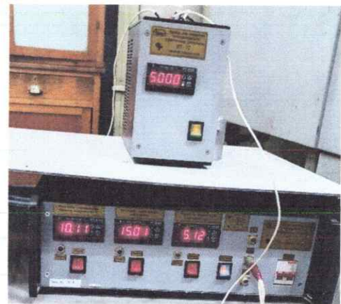
Рисунок 2 – Установка для визначення теплопровідності згідно з ДСТУ Б В.2.7-105-2000 (ГОСТ 7076-99)